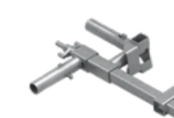
Uchwyt schodowy EPS-UUN-V4 7 kg