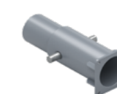
Uchwyt tracony pionowy EPS-UZV-V2 0,2 kg