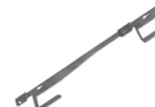
Podwójny uchwyt ścienny EPS-US2 1,7 kg