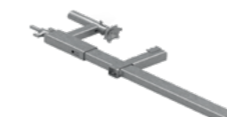
Uchwyt zaciskowy L800 EPS-UUN800-V2 8,5 kg