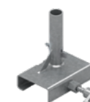
Uchwyt dźwigarowy EPS-UDZ-V2 3,4 kg