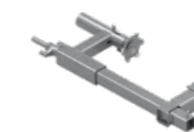
Uchwyt zaciskowy L500 EPS-UUN-V2 5,5 kg