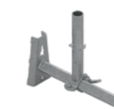
Uchwyt fasadowy EPS-USP 3,9 kg