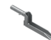
Uchwyt wbijany EPS-UWB 3 kg