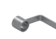
Uchwyt dolny deski EPS-UDS 0,3 kg