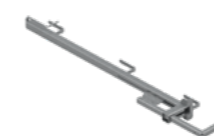
Uchwyt zaciskowy ze słupkiem EPS-UUS 7,2 kg