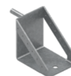
Uchwyt podestu roboczego EPS-UPR 1,8 kg